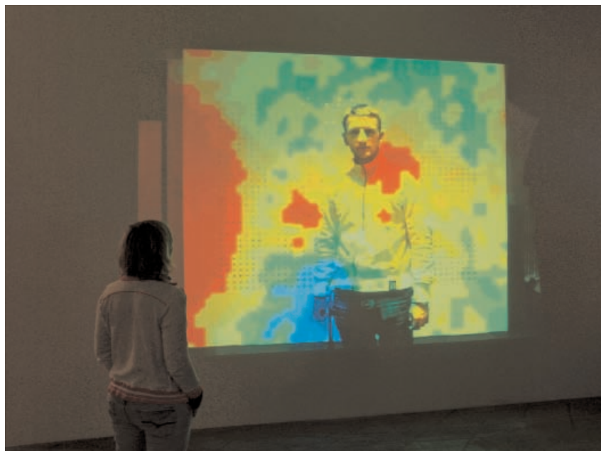
Jens Brand, "Red Psi Donkey", 2008.

Nombreux sont les artistes contemporains qui travaillent sur la notion de perception, à l'instar de l'Allemand Jens Brand, lauréat d'une mention d'honneur en Art interactif pour son installation audiovisuelle intitulée Red Psi Donkey . Il s'agit d'un dispositif générant des ondes sonores inaudibles qu'une "caméra acoustique" transforme en image, celle d'un âne rouge. Mais toute présence humaine interférant avec l'espace sonore environnant induit une détérioration de cette représentation éphémère. Ainsi, si l'on considère l'affichage de cet âne rouge comme le résultat d'un processus artistique, le visiteur est celui qui cause sa détérioration temporaire. En d'autres termes, cette œuvre atteindrait son idéal uniquement lorsqu'elle serait privée de tout spectateur, dans le silence ou presque. On pense alors à ces conservateurs qui préservent du public les œuvres les plus fragiles de leurs collections de peur qu'elles ne s'abîment, comme aux fresques antiques qui, dans Fellini Roma , disparaissent sous les yeux de ceux qui les découvrent.