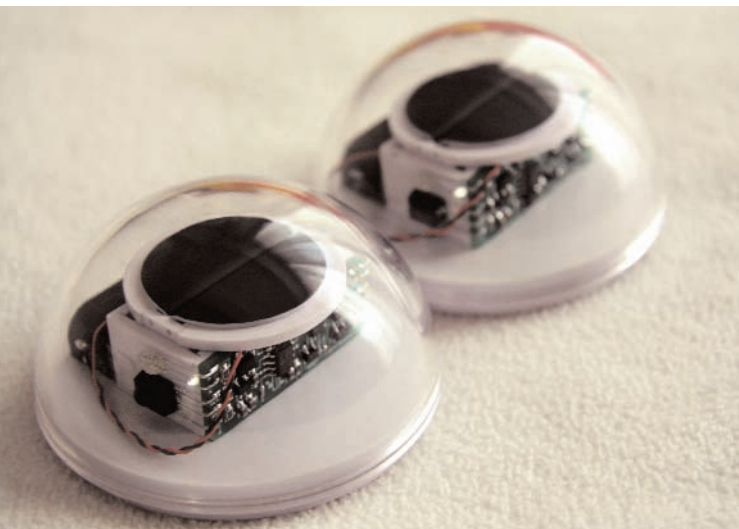
Ryota Kuwakubo, "Nicodama", 2009

Le premier niveau de l'Ars Electronica Center est en partie dédié à cette pratique, typiquement japonaise, que l'on qualifie de Device Art. Hiroo Iwata, professeur à l'université de Tsukuba, la situe à la convergence de l'art, de la technologie et du design, tout en précisant que les œuvres produites sont souvent jouables et parfois commercialisées. Les deux pièces de Ryota Kuwakubo, qui compte parmi les artistes exposés, en sont à ce titre d'excellents exemples. La première, LoopScape , se présente sous la forme d'un écran cylindrique constitué de diodes électroluminescentes, sur lequel deux joueurs peuvent s'affronter. Ces derniers sont ainsi contraints de tourner autour de l'installation. Mais alors attention, car les missiles envoyés peuvent se retourner contre leur propre vaisseau ! La seconde création, intitulée Nicodama , est constituée de deux demi-sphères interconnectées par une interface infrarouge ; elles représentent des globes oculaires ayant la capacité de clignoter selon des rythmes aléatoires. Et quand l'artiste les suspend à une chaise des plus ordinaires, qui semble alors nous observer, il l'humanise tout simplement.