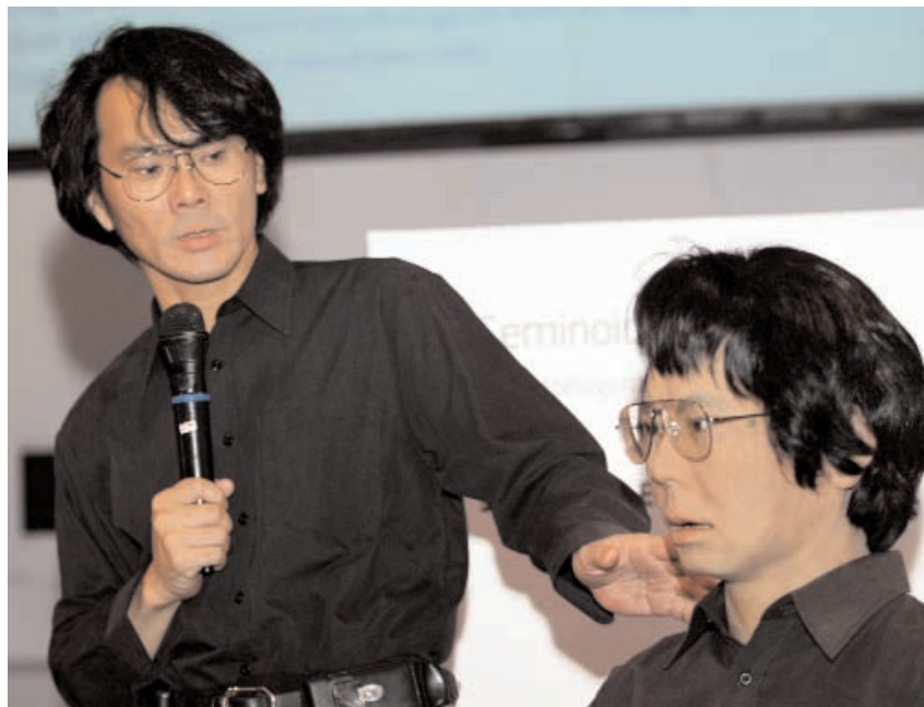
Hiroshi Ishiguro, "Geminoid HI-1", 2006.

La galerie principale du nouvel Ars Electronica Center regroupe quelques minilaboratoires à vocation pédagogique, dont le RoboLab où le modèle HI-1, de la série des Geminoids, est exposé. Conçu à l'image du professeur Hiroshi Ishiguro de l'université d'Osaka, il est entouré de quelques jeunes qui tentent en vain de le mettre en difficulté en le harcelant d'une multitude de questions d'ordre musical ou cinématographique. Il a réponse à tout. Aussi, le lendemain, je tente ma chance en le questionnant sur ses éventuels rêves ou quant à l'existence de Dieu ! Mais il semble moins loquace que la veille. Toutefois, je dois reconnaître qu'un sentiment bizarre m'envahit lorsque son regard croise le mien. Il semble respirer, bouge la tête et cligne des yeux. Il est même difficile de distinguer, en photographie, le créateur de son clone. Et c'est en montant à l'étage que je comprends qu'il ne s'agit en réalité que d'un "fake", dans la plus pure tradition des automates des XVIII e et XIX e siècles. Car c'est un humain qui le contrôle. Il n'est pas question ici d'intelligence artificielle, mais bien de présence humaine.