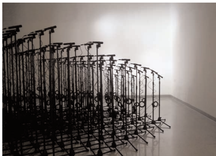
Daniel Sauter & Fabian Winkler, "In the Line of Sight", 2009.

In the Line of Sight est une installation dont l'élégante plasticité séduit autant qu'elle intrigue. Ce dispositif regroupe une centaine de lampes torches fixées sur des pieds de microphone. Elles sont toutes contrôlées numériquement et leur disposition dans l'espace permet de reconstituer des séquences vidéo sur le mur qui leur fait face. L'image qui en résulte, inévitablement, est totalement floue. Aussi il est impossible de distinguer quelque forme que ce soit dans cet assemblage d'ombres et de lumières - c'est du reste une spécialité que de reconnaître les mouvements dits "suspects" au sein de séquences vidéo acquises dans des conditions parfois extrêmes et souvent en basse résolution. Quant aux spectateurs, ils ont la possibilité de pénétrer dans la lumière, dans la ligne de mire de ces lampes torches portant la marque du célèbre fabricant d'arme Smith & Wesson. Ainsi traqués, ils participent, par leur gestualité, de l'histoire qui se déroule sous leurs yeux dans les passages entre les ombres et les lumières.