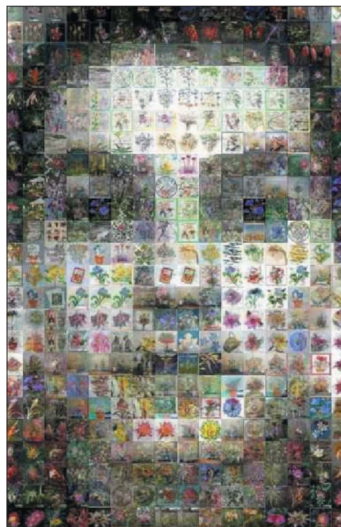
Reynald Drouhin, Des fleurs (image générative).